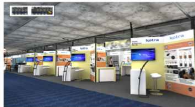
EXHIBITOR MODULE _ MIDDLE Y-TYPE 3 Companies per 1 module