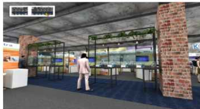
INTEGRATED DISPLAYING Product Display _ Front side view