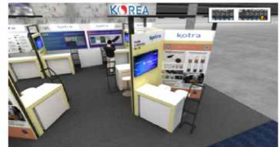
EXHIBITOR MODULE _ MIDDLE Y-TYPE 3 Companies per 1 module