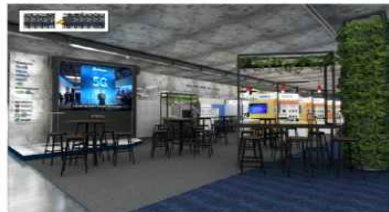
PITCHING & LOUNGE AREA Meeting Lounge & Pitching Stage