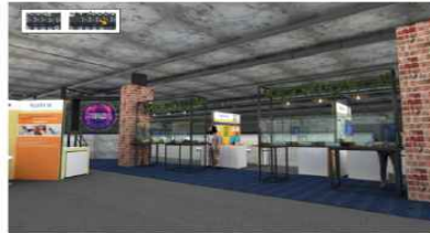
INTEGRATED DISPLAYING Product Display _ Rear Side View