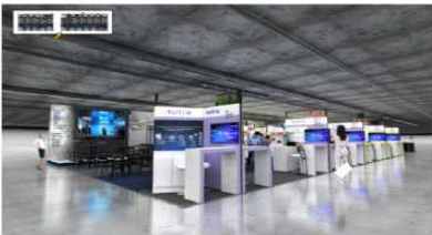
ENTERING POINT VIEW _ CENTER AISLE