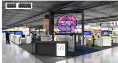
RECEPTION DESK Information & HyperVSN PR