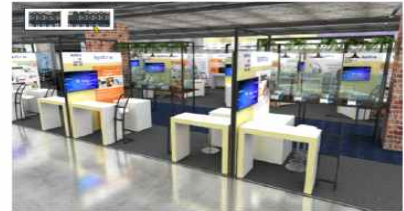
EXHIBITOR MODULE _ FRONT I-TYPE 2 Companies per 1 module